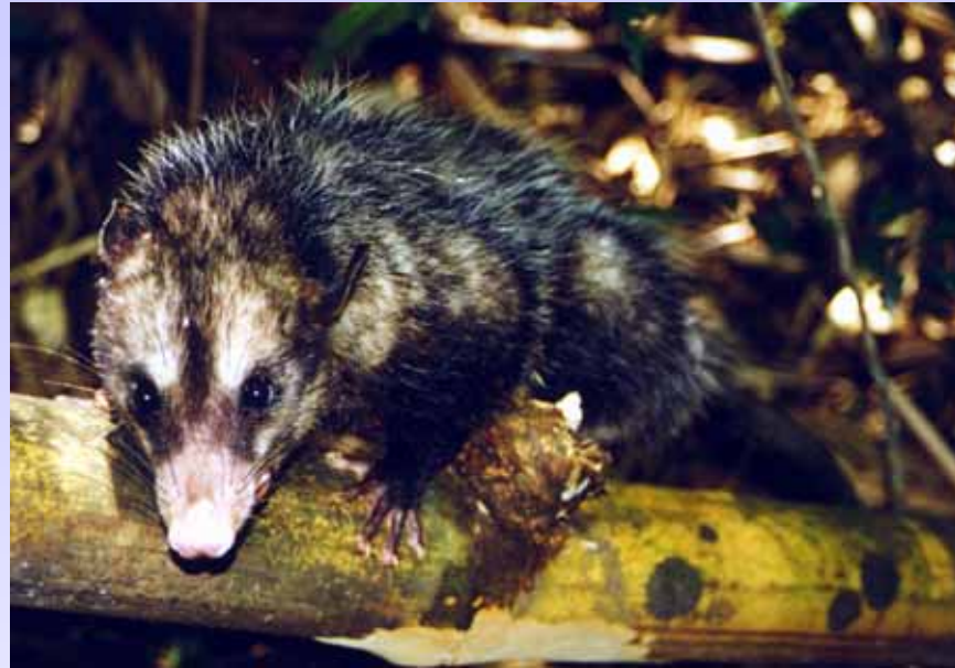
Didelphis aurita (ca. 1800 g)