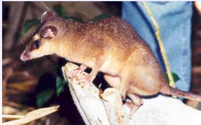
Metachirus nudicaudatus (ca. 450 g) Prof. Marcus Vinícius Vieira – Instituto de Biologia UFRJ