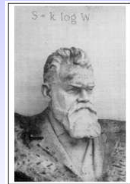
Figure 1 - Boltzmann's Theorem Engraved on his Tomb in Vienna (1906)